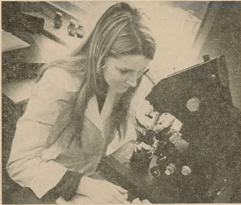
У ЛАБАРАТОРЫІ БІЯФАКА

У ЦЯПЕРАШНІ час біялогія як тэарэтычная аснова медыцыны, сельскай, лясной і паляўнічай гаспадаркі і шэрагу іншых біялагічных вытворчасцей (антыбіётыкаў, біяпрэпаратаў, бактэрыялагічных угнаенняў) стала непасрэднай вытворчай сілай. Перад біялогіяй стаіць таксама грандыёзная і вельмі актуальная задача: дасканаласць біялагічных рэсурсы наземнага і воднага жывёльнага і расліннага свету нашай планеты і зберагчы яго.